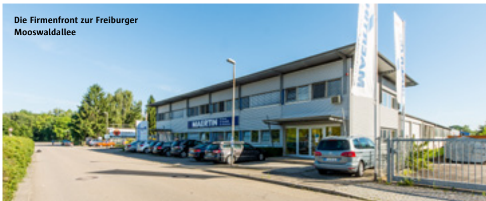
Die Firmenfront zur Freiburger Mooswaldallee

Kontakt: Maertin & Co. AG, Fax +49 761 514 5664, E-Mail: info@maertin-freiburg.de , www.maertin-freiburg.de